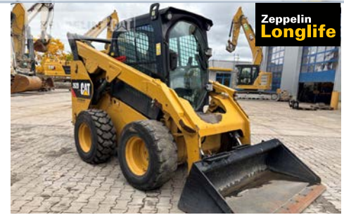
Cat Kompaktlader 262D Serien-Nr. RE500165 | Cottbus