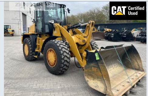
Cat Radlader 914-14 Serien-Nr. JC300819 | Oberhausen