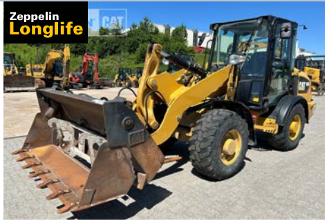
Cat Radlader 906M Serien-Nr. K5600757 | Dresden

2019, 2.930 hrs, Kombischaufel, Schaufelzustand: 60 % gut, Staplereinrichtung, 3. Steuerkreis, Schnellwechsler hydraulisch