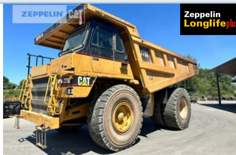
Cat Muldenkipper 775E Serien-Nr. BEC76002 | Frankenthal