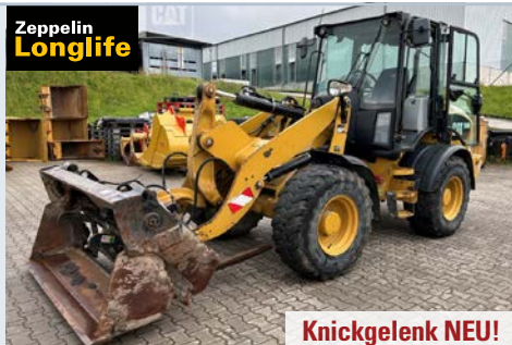
Cat Radlader 908M Serien-Nr. H8803145 | Chemnitz