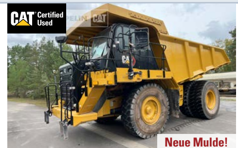
Cat Muldenkipper 775G Serien-Nr. MJS02483 | Magdeburg