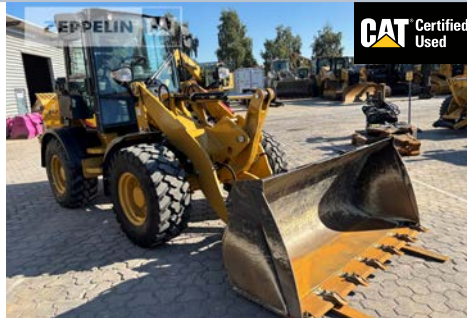
Cat Radlader 908-14 Serien-Nr. HZ800242 | Hamburg