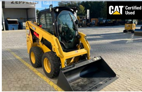
Cat Kompaktlader 226D Serien-Nr. EK500995 | Straubing

2022, 416 hrs, Fronttür, Erdbauschaufel mit Messer, Schaufelvolumen: 0,3 m³, Schaufelzustand: 100 % gut, 3. Steuerkreis, Reifenzustand: 90 % gut, Schnellwechsler hydraulisch, Klimaanlage