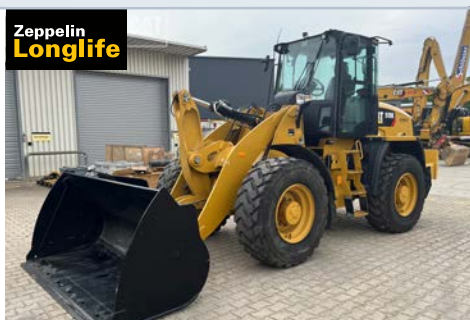
Cat Radlader 918M Serien-Nr. H2601265 | Ulm