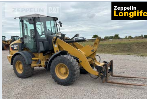
Cat Radlader 908M Serien-Nr. H8802748 | Erlangen