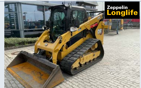
Cat Kompaktlader 299D Serien-Nr. DY900947 | Koblenz