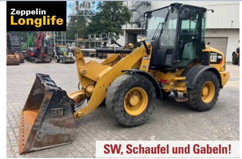
Cat Radlader 908M Serien-Nr. Z8800547 | Osnabrück