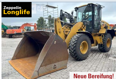
Cat Radlader 926M Serien-Nr. LTE07221 | Hamburg