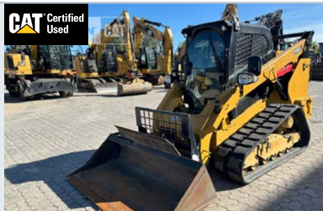
Cat Kompaktlader 289D Serien-Nr. BT900861 | Hamburg