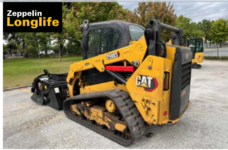
Cat Kompaktlader 259D Serien-Nr. TE900671 | Hamm