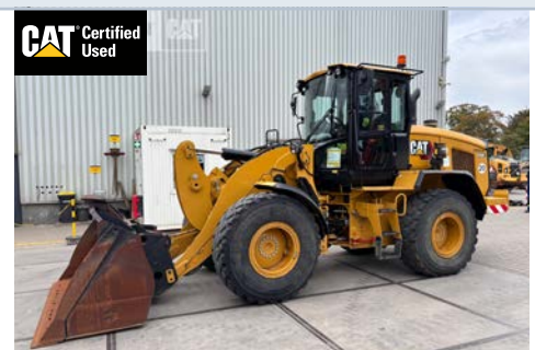
Cat Radlader 926M Serien-Nr. W5L00934 | Hannover