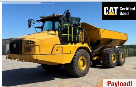
Cat Dumper 730-04 Serien-Nr. 3T301500 | Berlin