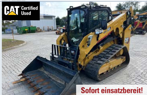
Cat Kompaktlader 265 Serien-Nr. KR402666 | Rendsburg